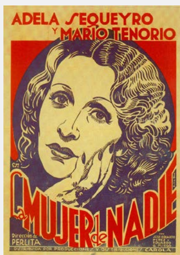
Pòster de la pel·lícula La mujer de nadie (1937)

Observeu el següent pòster de la pel·lícula mexicana La Mujer de nadie (1937).