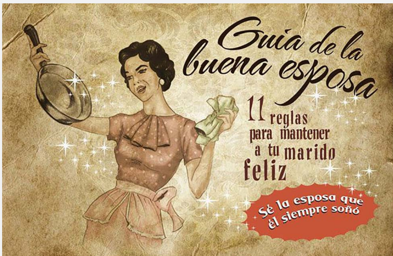
Imatge de la Guía de la Buena Esposa , de la Secció Femenina de la Falange

En acabar la Guerra, el règim franquista s'encarregà d'instaurar un model social i cultural opressiu en què la dona va quedar reduïda a dos conceptes: esposa i mare. La Secció Femenina de la Falange, liderada per Pilar Primo de Rivera, va orquestrar un sistema perfecte per crear generacions de dones alienades i obedients als principis del règim.