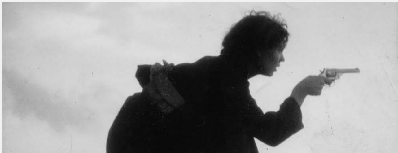
Milliciana de la Guerra Civil espanyola

La guerra és una de les experiències més commovedores que pot viure una persona. En circumstàncies adverses, l'art es converteix en una manera de canalitzar els sentiments i l'horror viscuts. Com van viure la Guerra Civil espanyola la generació de dones artistes d'aquell moment? Quin és el seu llegat?