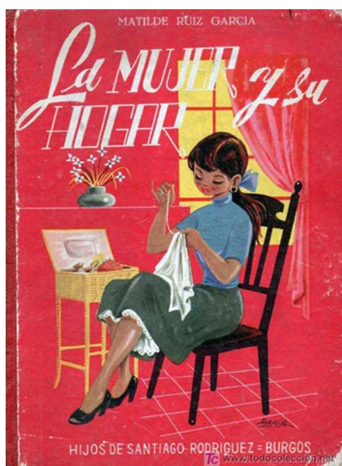
Portada de La Mujer y su hogar , de Matilde Ruiz