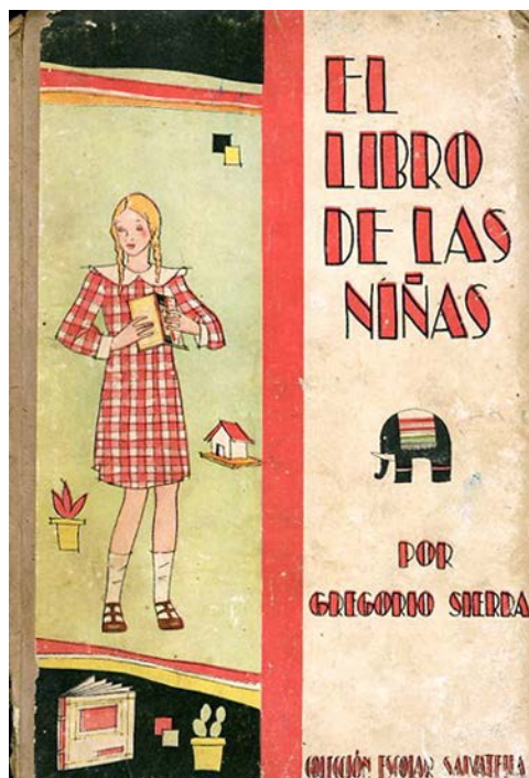
Portada de El libro de las niñas , de Gregorio Sierra