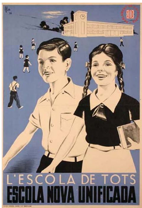
Cartell de l'Escola Nova Unificada